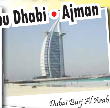
Dubai Burj Al Arab